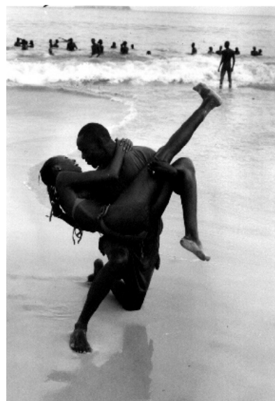
Pape Seydi Série Mélodies. Senegal 2002

Describe aquestes fotografies. Què hi veus? Quins són els elements més destacats? Les tres fotografies són molt diferents. Assenyala les diferències més visibles. Veus algunes característiques comunes? Quina és l'expressió de la dona de la fotografia de Van Léo? Imagina que podria estar pensant o somiant. Creus que li agradaria viure en la casa de la fotografia de Santu Mofokeng? Per què? Quina sensació et produeix la fotografia de Pape Seydi? És més espontània o menys que la de Van Léo? Per què et produeix aquesta impressió? Com viuen els habitants de la barraca? Penses que si poguessin intentarien viure en un altre lloc? Pots relacionar aquest desig de marxar del seu país amb fets que són notícia diàriament als mitjans de comunicació europeus?