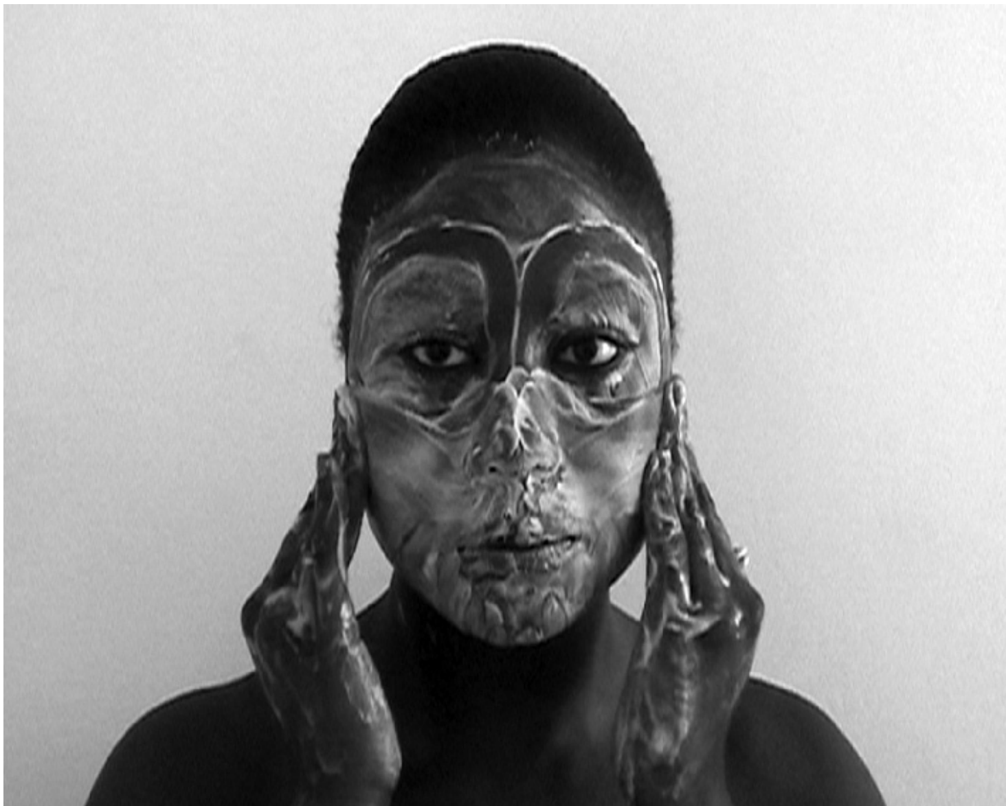
Michèle Magma Sèrie Els meus petits rituals. 2000

Quan darrera d'una càmera fotogràfica es troba algú amb talent i sensibilitat, el reflex de la realitat que finalment impressiona el paper és gairebé sempre un estímul que desperta emocions i fa pensar.